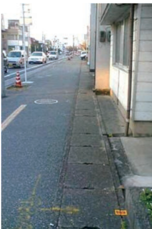
▼レインスルー敷設