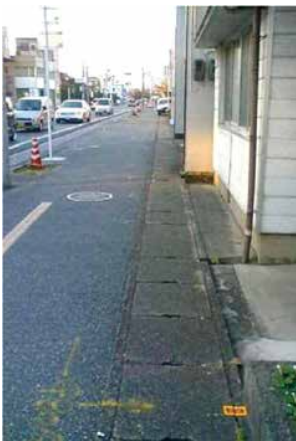
▼レインスルー敷設