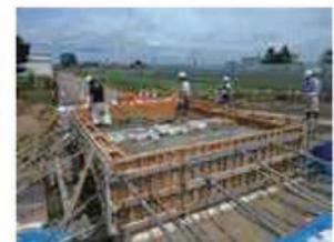
バックフィルコンクリート打込