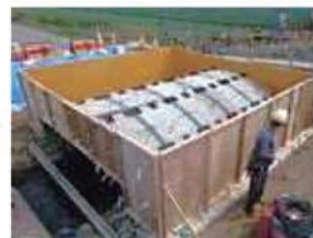
バックフィル用型枠組立完了