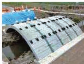
アーチリング施工完了