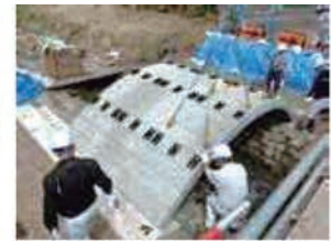
アーチリング据付