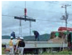
アーチリング搬入