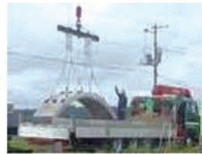
アーチリング吊上