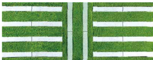
ボーダー方向転換

※敷設パターンを変えることにより車両耐荷重や緑化率が変えられることが特徴の商品で、目的や用途に応じた対応ができる商品です。