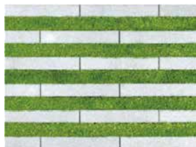
芝幅50mm張り(緑化率:約50%) ※設計上耐荷重:車両総重量14t