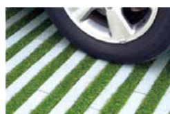
グラス・ハイブリックボーダーとグラスボーダーの組み合わせ。

グラスボーダーを使用の場合には、充填モルタル等のかわりに、インターロッキングブロック(200×100×60H)をご使用いただけます。※当社品に限る。