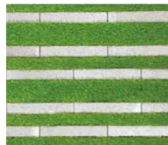
芝幅ランダム張り