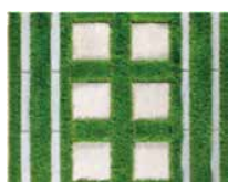
グラス・ハイブリックDとグラスハイブリックと組み合わせてもご使用いただけます。