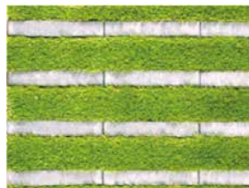
芝幅100mm張り(緑化率:約67%) ※設計上耐荷重:車両総重量8t