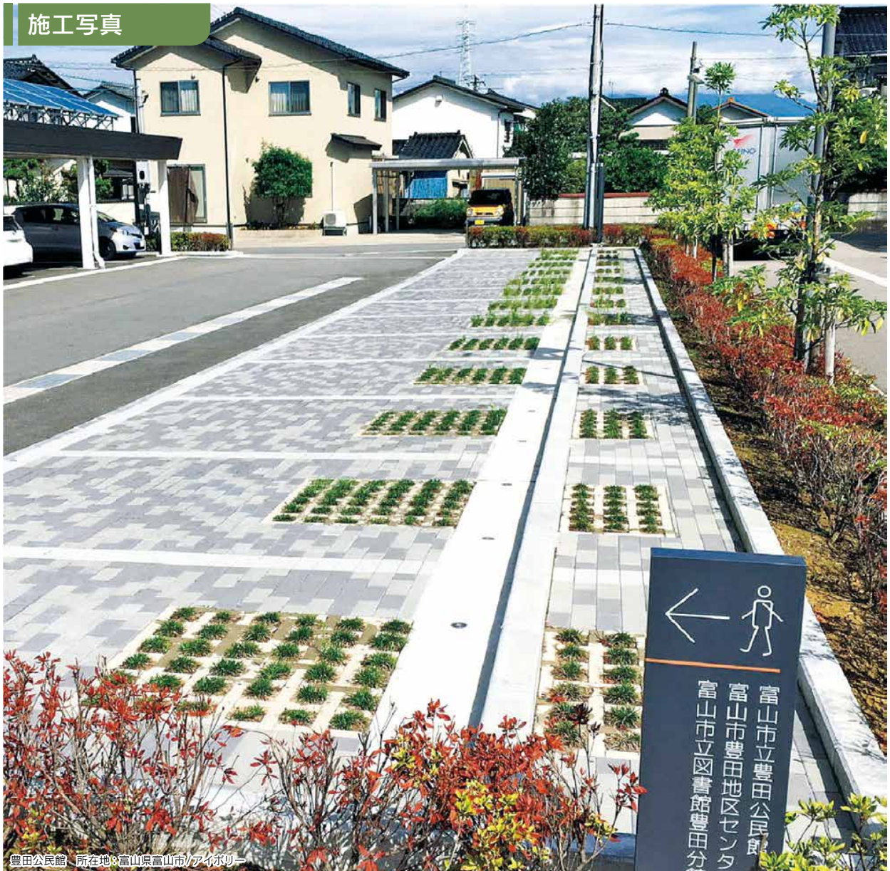
豊田公民館 所在地:富山県富山市/アイボリー