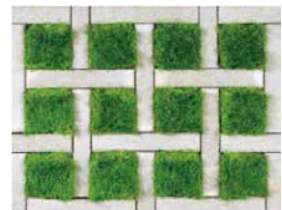
格子張り(緑化率:約51%) ※設計上耐荷重:車両総重量8t