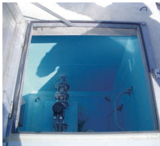
次亜塩素素注入ピット