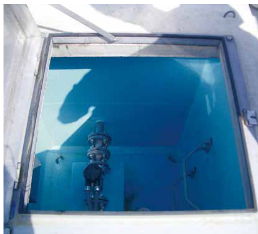
次亜塩素素注入ピット