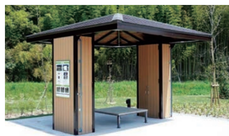
普段の東屋（公園などの休憩所として使用）