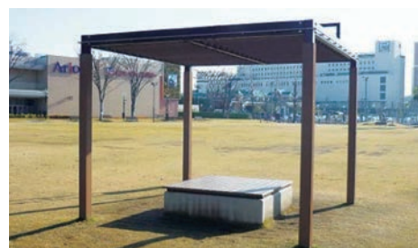
普段のパーゴラ（公園の休憩所として使用）