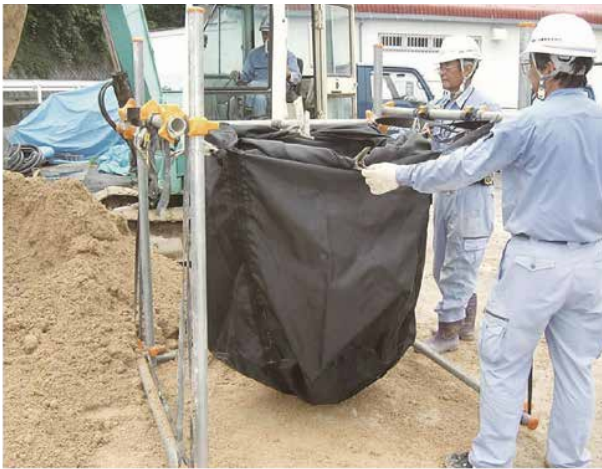
①TKバックを地面に対してやや宙ぶり気味にセットします。