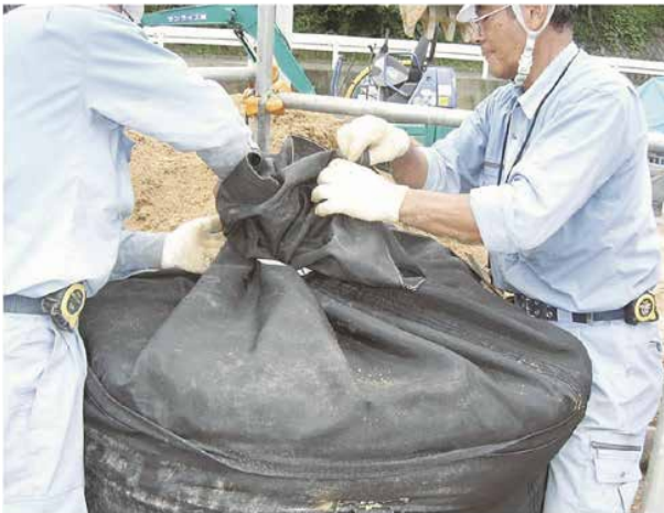
③充填が完了したら投入口縛り紐で投入口を縛ります。