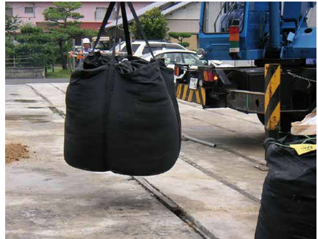
④取扱についての注意事項を守って設置作業をしてください。