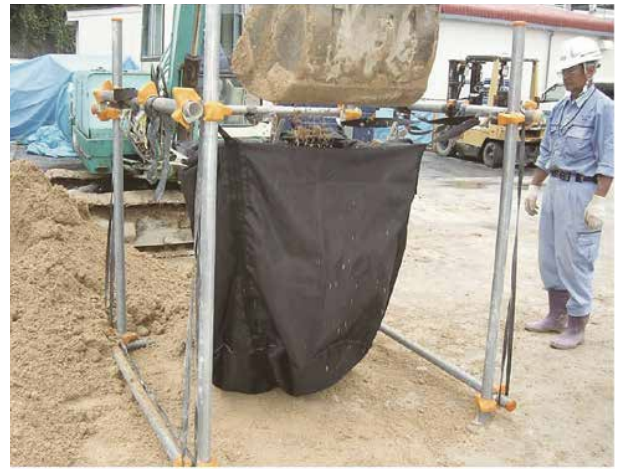
②TKバックの変形や損傷に注意しながら土砂を充填します。