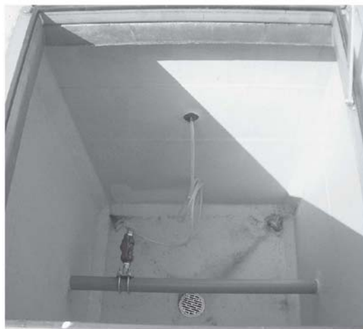
次亜塩素素注入ピット